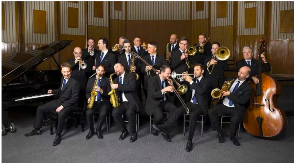
Au Léman Bouquet Festival de Genève, la journée cyclomusicale du 27 juin se conclura par les notes bleues du Budapest Jazz Orchestra.