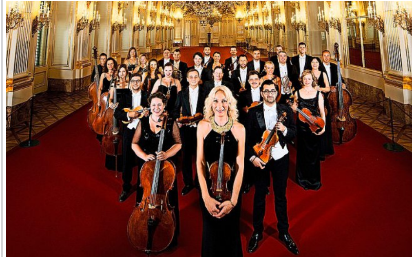
Le Schloss Schönbrunn Orchester de Vienne.

Montreux-Vevey Du 19 au 29 sept. www.septmus.ch