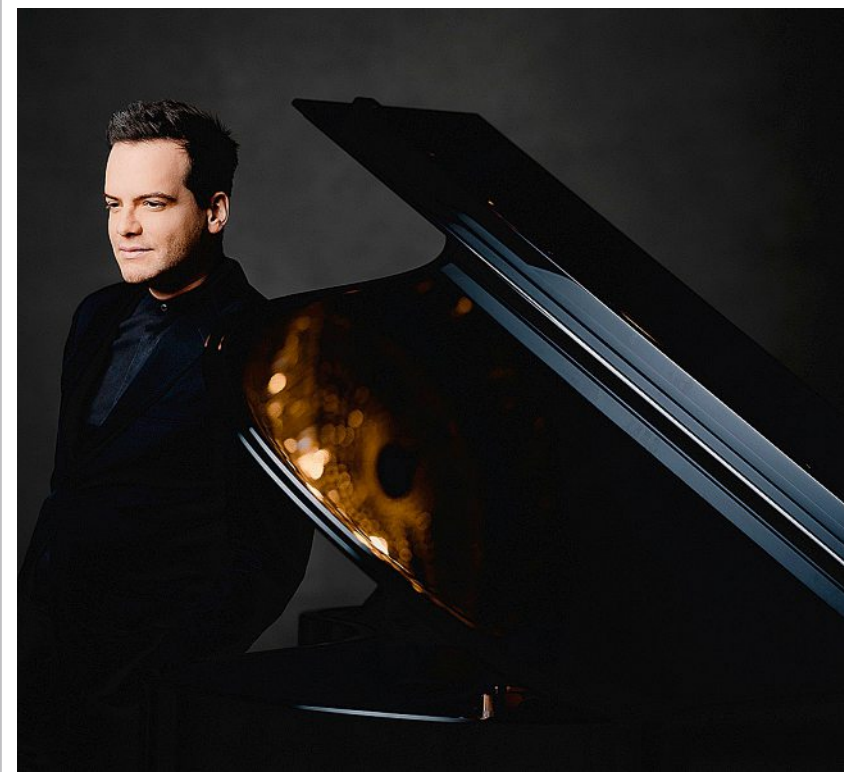
Francesco Piemontesi joue ce dimanche 5 juin.

Vevey, Théâtre Le Reflet Du 3 au 5 juin www.veveyspringclassic.ch