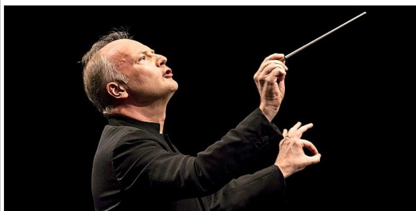
Gianandrea Noseda en ouverture le 15 juillet.